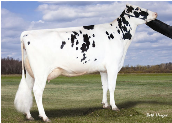
RABUR S PADORA Granddam